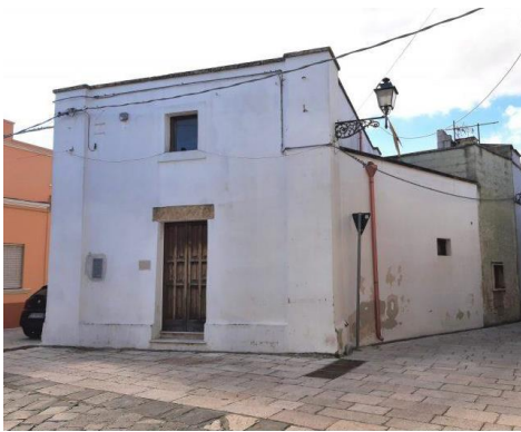
Spazio espositivo (ex Chiesa di S. Stefano)