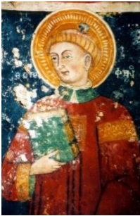
Veglie – S. Stefano. Cripta della Favana Affresco

La chiesa, da sempre, è appartenuta al Capitolo di Veglie che la governava con suoi speciali procuratori nominati annualmente con il compito di gestire le rendite dei beni e far celebrare le messe in numero proporzionale alle entrate ( secundum redditum ); con molta frequenza però si verificava che i procuratori non svolgessero correttamente il compito che era stato loro affidato perché preferivano far confluire gli utili nella massa comune del capitolo per poi ripartirseli a fine anno con gli altri sacerdoti.