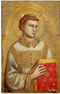
Santo Stefano dipinto di Giotto, databile 1330-35, Firenze (da internet)