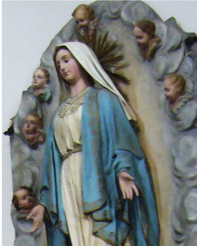
Fig. 4 – Statua della Madonna Immacolata (cartapesta)