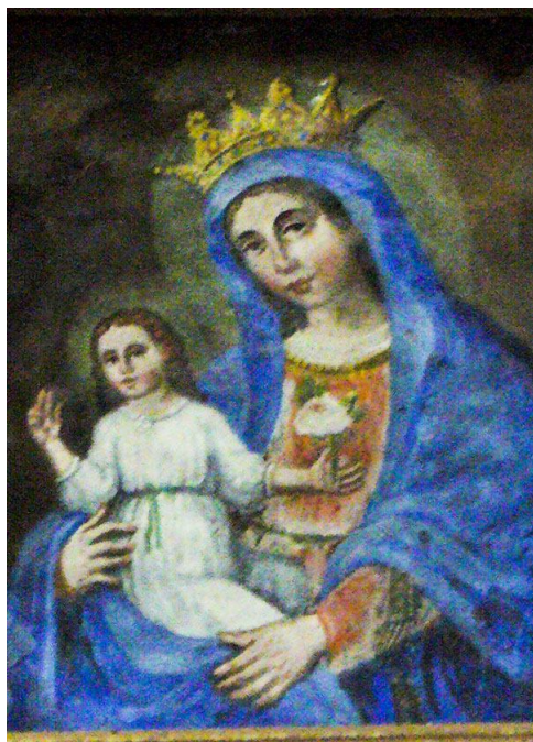
Fig. 1 - Affresco della Madonna delle Grazie nell'altare principale

Nel XVI secolo sorgeva a Veglie, nello stesso luogo dove oggi c'è la chiesa della Madonna delle Grazie, a ridosso delle antiche mura, una chiesetta, volgarmente detta della Linea 1 , costruita dal capitolo di Veglie tra il 1566 e il 1580, nel cui interno c'era un solo altare eretto in onore del SS. Crocefisso dal quale la stessa chiesa prendeva il nome. ( Cappella sub titulo Crocefixi della linea extra, et prope moenia dicta Terra ).